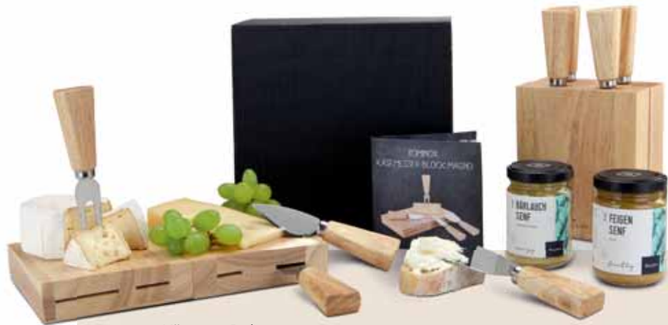
Käse nur Deko

Servieren Sie Käse geschmackvoll und praktisch zugleich. Dieses Käse-Trio enthält ein innovatives ROMINOX® Käsemesser-Set inklusive Block und je 145 g Bärlauch- und Feigensenf im Glas. Der Block dient stehend zur Aufbewahrung der 4 Käsebesteckteile und ist liegend ein flexibles Käsebrett (die zwei Hälften haften magnetisch aneinander). Ein Infolyer beschreibt die beiden Senf-Varianten sowie den Einsatz des Käsemesserblocks. Alles zusammen in einem schwarzen Karton – Fromage savoureux!