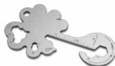
Key Tool Lucky Charm (19 Funktionen) Endung „m“

Werben Sie mit praktischen Multifunktionsstools als Schlüsselanhänger. Mit den kleinen Begleitern von ROMINOX® sind die praktischsten Werkzeuge wie Schraubenzieher, Lineal oder Sechskantschlüssel immer dabei, egal ob im Alltag, im Büro oder auf Reisen. Wählen Sie aus verschiedenen Tools und Mäppchen mit Motiv-Aufdruck (inkl. Einleger mit Funktionsbeschreibung). Auf Wunsch auch mit Gravur oder Mäppchen im Eigendesign.