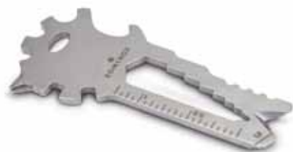
Key Tool Lion (21 Funktionen) Endung „b“

Kombinieren Sie Ihr Wunsch-Mäppchen mit Ihrem Wunsch-Key Tool