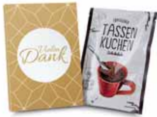
Vielen Dank 2K1357e