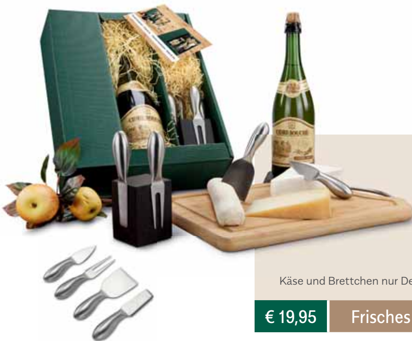
Käse und Brettchen nur Deko

Ein Präsent mit dem Sie sich abheben! Leckerer Cidre, ein Apfelschaumwein aus Frankreich (0,75 l), kombiniert mit einem praktischen, magnetischen ROMINOX® Käsemesser-Block und vier Besteckteilen für alle Käsearten. Auf einem Kärtchen finden Sie zudem interessante Informationen zum Block und zum Wein. In grünem Geschenkkarton mit Sizzle cream.