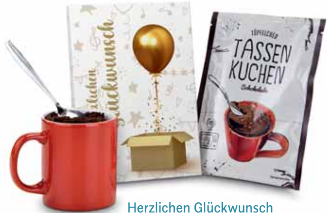
Herzlichen Glückwunsch 2K1357g