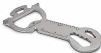
Key Tool Snake (18 Funktionen) Endung „c“