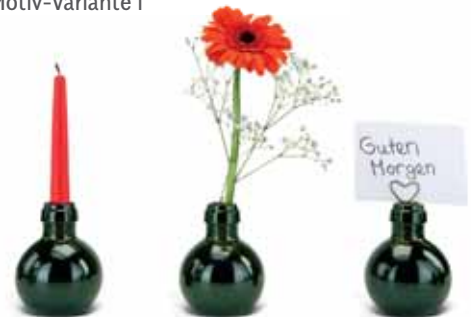
Anwendungsbeispiel für eine nachhaltige Verwendung

Kleinste Sektflasche ohne Geschenkkarton 2K1540